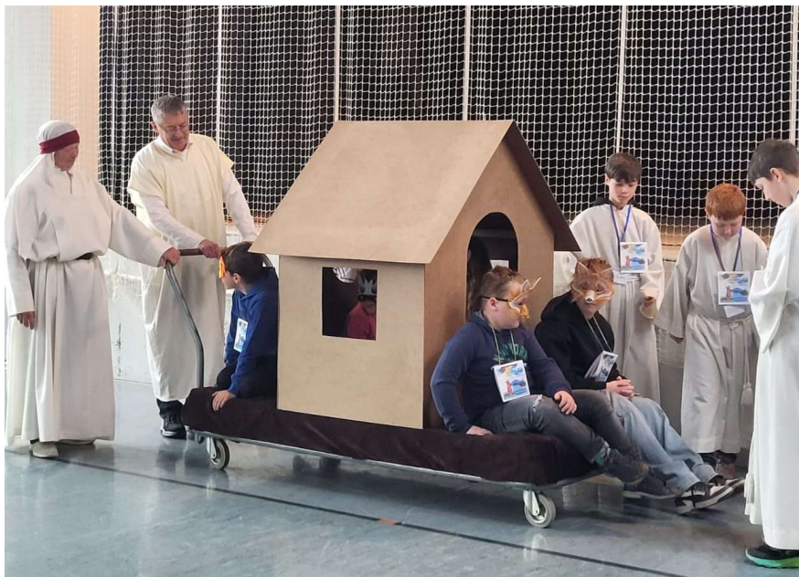
Kinderbibeltag am 21. März 2026 mit der Arche Noah